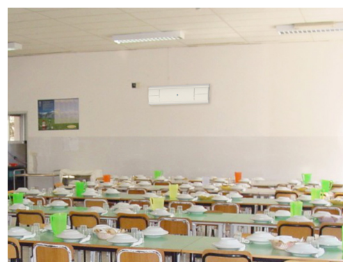
Esempio di applicazione

La tecnologia UV-C è un metodo di disinfezione fisico con un ottimo rapporto costi/benefici, è ecologico e, al contrario degli agenti chimici, funziona contro tutti i microrganismi senza creare resistenze.